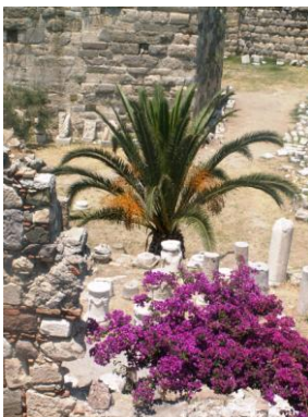
Im Hof der Burg Neratzia (Kos Stadt)