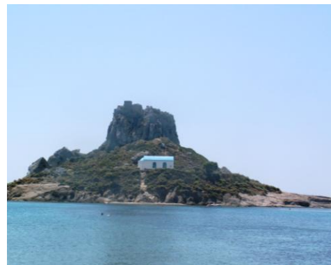
Insel Kasti bei Kefalos (Kos)